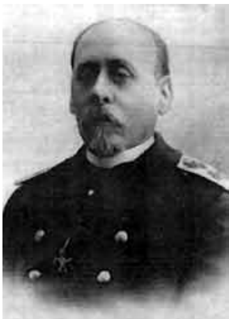
Рис. 2. Вице-адмирал Г.П. Чухнин

ров для успешного развития мятежа стала растерянность командующего флотом адмирала Г.П. Чухнина, телеграфировавшего царю: «Положение безвыходное; матросы, вероятно, поставят какие-нибудь условия, которым придется подчиниться или распустить флот» [10].