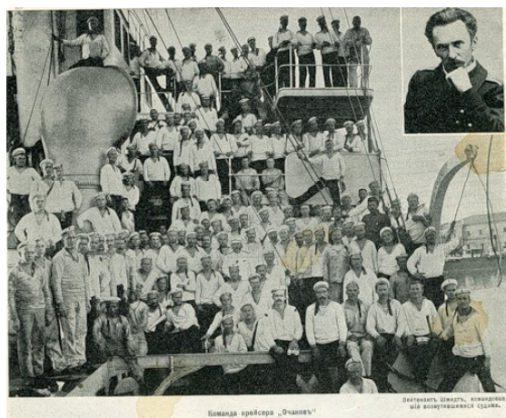
Рис. 1. Команда крейсера «Очаково»

11 ноября 1905 г. в Севастополе начался организованный социал-демократами мятеж среди матросов Флотского экипажа и солдат Брестского полка. За несколько часов к мятежу примкнуло свыше 2 тыс. матросов флотской дивизии, часть солдат 49-го Брестского полка, запасной батальон крепостной артиллерии и рабочих порта. Мятежники арестовывали офицеров, предъявляли политические и экономические требования властям. Одним из факто-