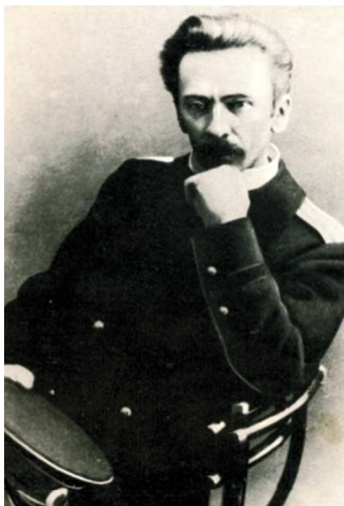
Рис. 3. П.П. Шмидт

Во время бесконечных митингов среди ораторов выделялся человек в форме лейтенанта военно-морского флота, говоривший о верности делу демократии, «о защите с оружием в руках свобод, обещанных в манифесте 17 октября» [4]. Его имя было Пётр Петрович Шмидт.