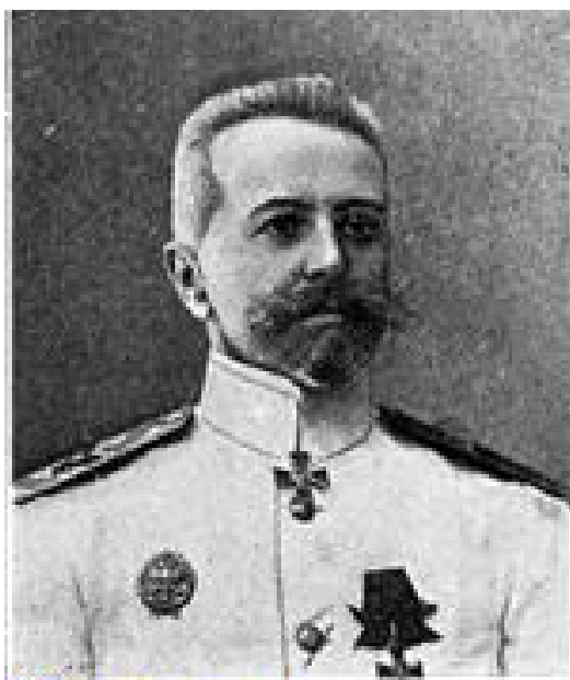
Рис. 4. Вице-адмирал Н.И. Скрыдлов